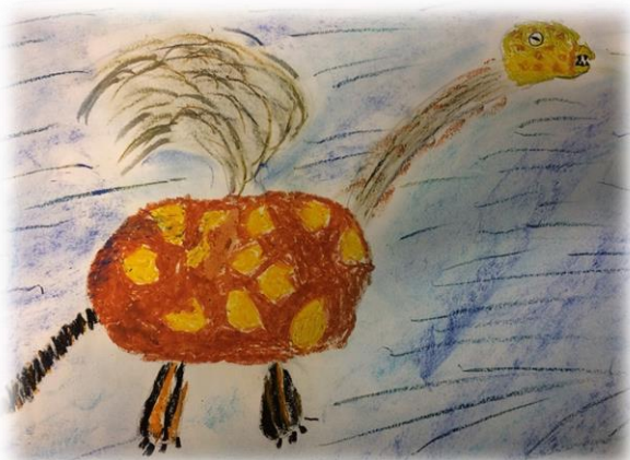
Giraffenvogel von Florian