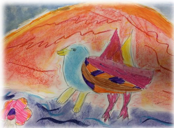
Feuervogel von Sandra